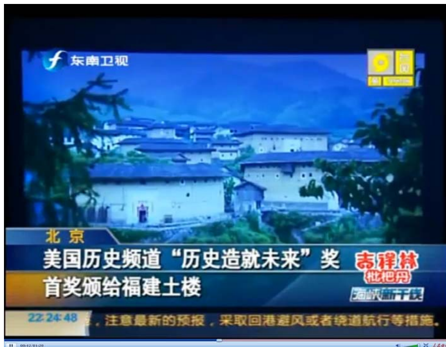
图 2 美国历史频道“历史造就未来-客家土楼”将通过 30 种语言覆盖全球 150 多个国家和地区播放