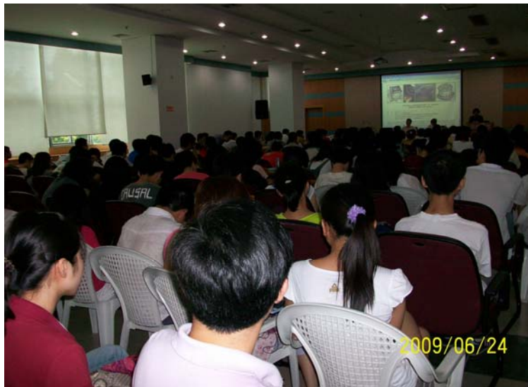
图 1 第一届客家土楼论坛会场，2009 年 6 月 24 日，厦门大学主楼会议厅

2011 年客家土楼论坛: 可持续发展的结构暨夯土材料与结构国际研讨会将于 2011 年 10 月 28 日至 31 日在厦门大学召开，届时有几十位来自美国，英国，法国，澳大利亚，日本，加拿大，意大利，新加坡，瑞士和中国的工程与建筑专家和人文学者共同探讨客家土楼的历史与文化价值，科学与工程价值及对现代可持续发展建筑的启示。这次客家土楼论坛作为厦门大学雷鹰教授组织的 2011 年土木工程结构的创新与可持续能力国际会议的特别专题与会议同期举行。